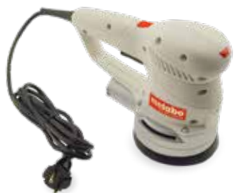
Carcasa de lijadora impresa con material DuraForm PA

Los sistemas sPro SLS de 3D Systems siguen el mismo procedimiento para producir piezas termoplásticas de alta resolución y duraderas de tamaño medio o grande.