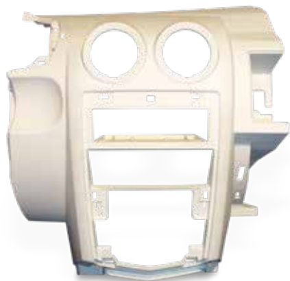
Consola DuraForm PA