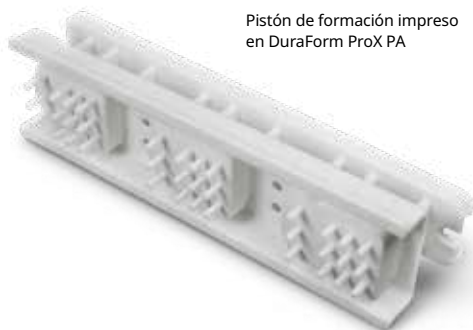
Pistón de formación impreso en DuraForm ProX PA

Garantía/aviso legal: Las características de funcionamiento de estos productos podrían variar según la aplicación del producto, las condiciones de funcionamiento, el tipo de material con que se combinen o el uso final. 3D Systems no ofrece garantía de ningún tipo, explícita ni implícita, incluidas, entre otras, la garantía de comerciabilidad o de adecuación para un uso particular.