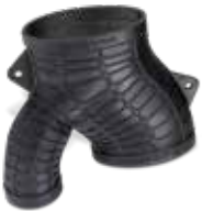
Figure 4 탄성 소재는 탁월한 형상 회복력, 압축 용도에 좋은 높은 인열 강도 및 재료 가단성이 우수해 기능성 유사 고무 부품의 생산에 적합합니다.