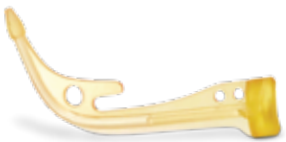
Figure 4 Production은 3D Systems의 전체 NextDent® 재료 포트폴리오와 호환되기 때문에 치과용 의료기기의 완벽한 주문 제작이 용이합니다. Figure 4 특수 재료 중에서 새크리피셜 툴링, 주열리 주조, 생체 적합성과 멸균을 요하는 의료 용도 등에 필요한 소재를 선택할 수도 있습니다.

사용 가능한 소재의 사양에 관해서는 소재 선택 장치 안내서 및 개별 소재 데이터시트를 참조하십시오.