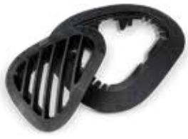
Figure 4 경질 소재를 사용하면 고속 프린팅, 높은 연신율, 뛰어난 충격 강도, 내습성, 장기간 환경 안정성 등의 특징을 포함해 주조 우레탄이나 사출 성형 부품과 동일한 외관과 촉감을 지닌 내구성이 뛰어난 플라스틱 부품을 생산할 수 있습니다.