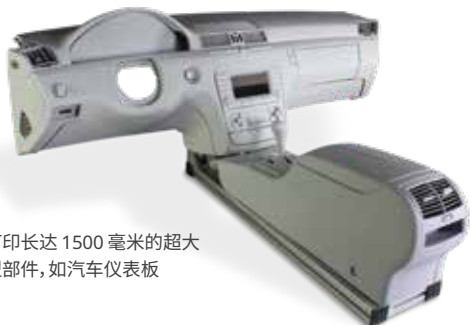
打印长达 1500 毫米的超大型部件, 如汽车仪表盘

ProX 800 和 ProX 950 SLA 打印机可构建具有卓越表面平滑度、分辨率、边缘清晰度和容差的部件。这两款打印机提供适合所有 3D 打印机的种类齐全的材料且工作效率高, 能够最大限度减少材料浪费, 维持较低的总拥有成本。再加上 3D Systems SLA 打印机拥有的卓越生产效率和可靠性, 无疑将成为专业服务机构的首选产品。